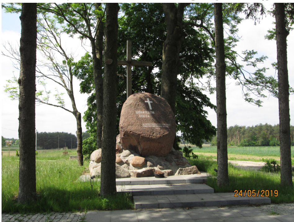
Fot. nr 13. Pomnik Powstańców Styczniowych, ul. Gościniec Niepodległości w Węgrowie.