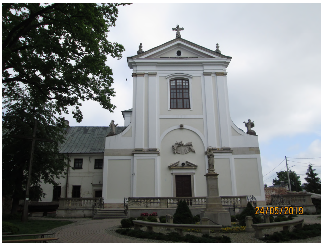
Fot. nr 2. Kościół parafialny pw. św. Piotra z Alkantary i św. Antoniego Padewskiego, poreformacki, ul. Kościuszki 29 w Węgrowie