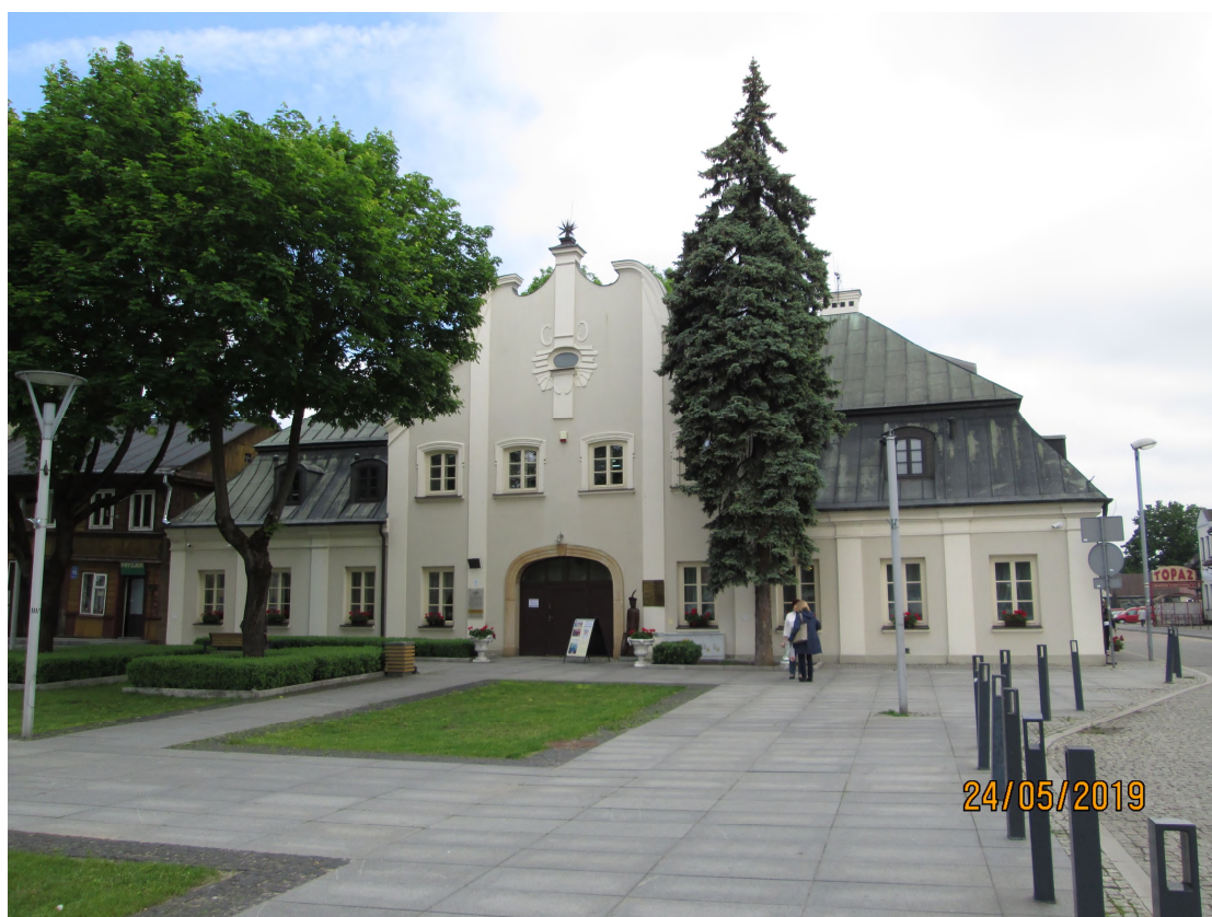
Fot. nr 10. Zajazd - Dom Gdański, ob. Miejska Biblioteka Publiczna, ul. Rynek Mariacki 11 w Węgrowie

Zajazd - Dom Gdański, obecnie Miejska Biblioteka Publiczna, ul. Rynek Mariacki 11 w Węgrowie