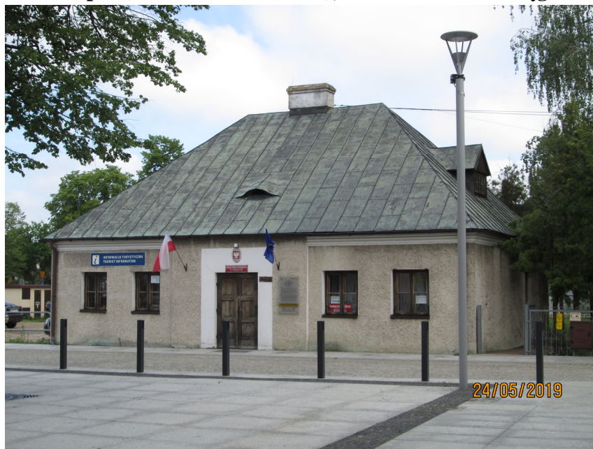
Fot. nr 12. Tzw. Dom Lipki (Drukarnia Ariańska), ul. Gdańska 2 w Węgrowie Datowanie: prawdopodobnie k. XVIII w.

Późnorenesansowy dom, utożsamiany z drukarnią. Obecna budowla (Urząd Stanu Cywilnego) zrekonstruowana od podstaw przez Polskie Pracownie Konserwacji Zabytków. Jednokondygnacyjny budynek na rzucie prostokąta, nakryty wysokim, namiotowym dachem. Wewnątrz dwutraktowy. Elewacje pozbawione podziałów, zwieńczone gzymsem.