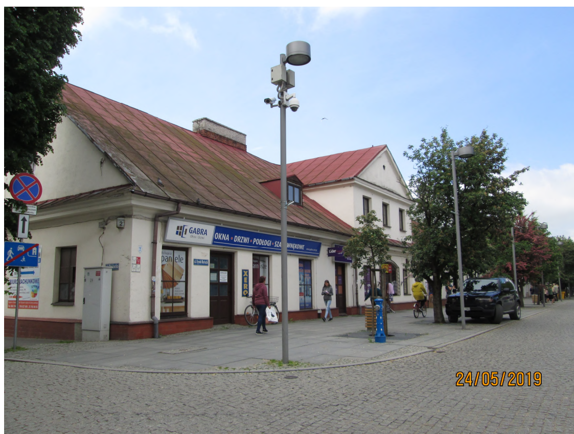
Fot. nr 11. Dawny zajazd, ul. Rynek Mariacki 14 w Węgrowie