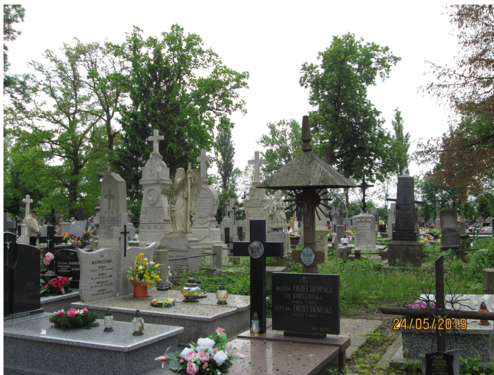
Fot. nr 4. Fragment cmentarza parafialnego rzymskokatolickiego.