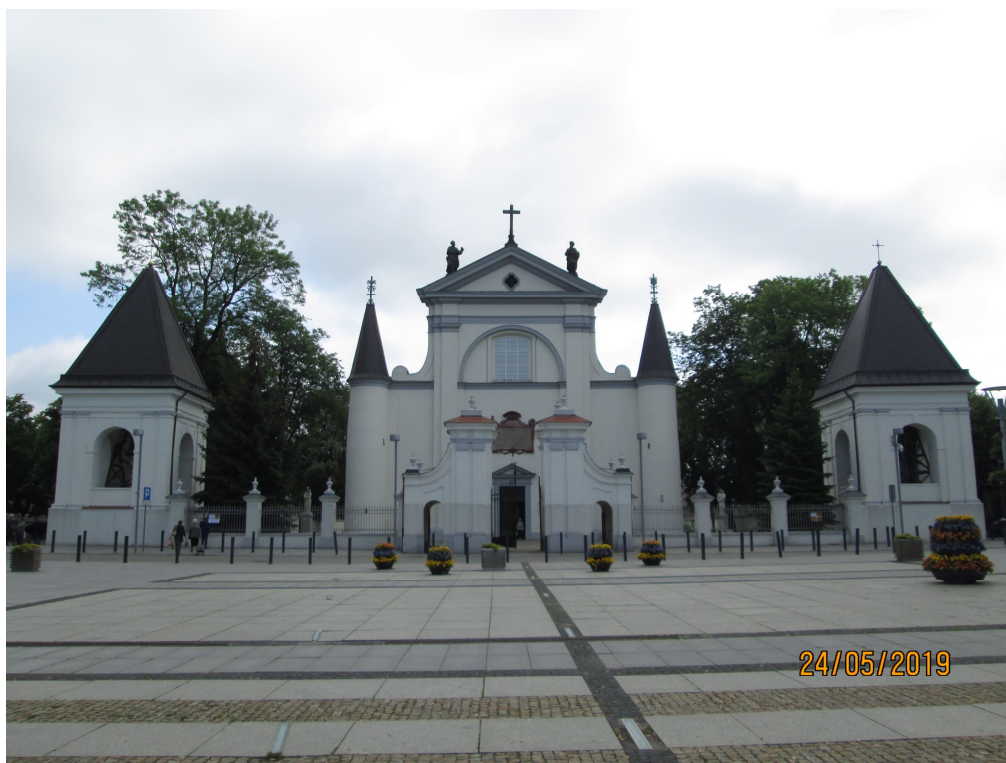
Fot. nr 1. Bazylika pw. Wniebowzięcia NMP, ul. Rynek Mariacki w Węgrowie