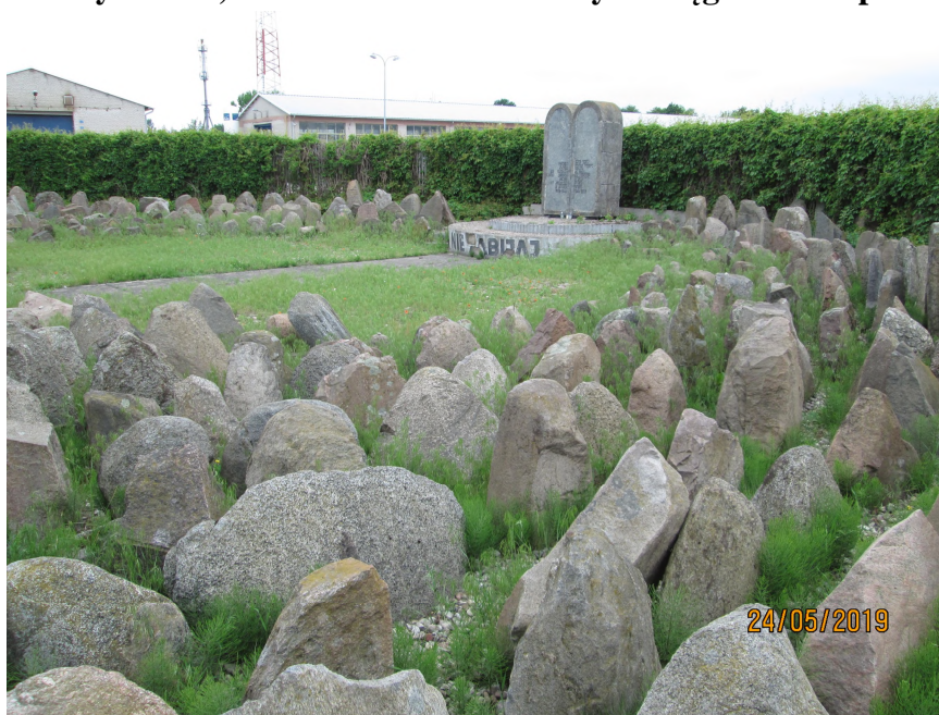
Fot. nr 9. Lapidarium na cmentarzu żydowskim, ul. Berka Joselewicza w Węgrowie.