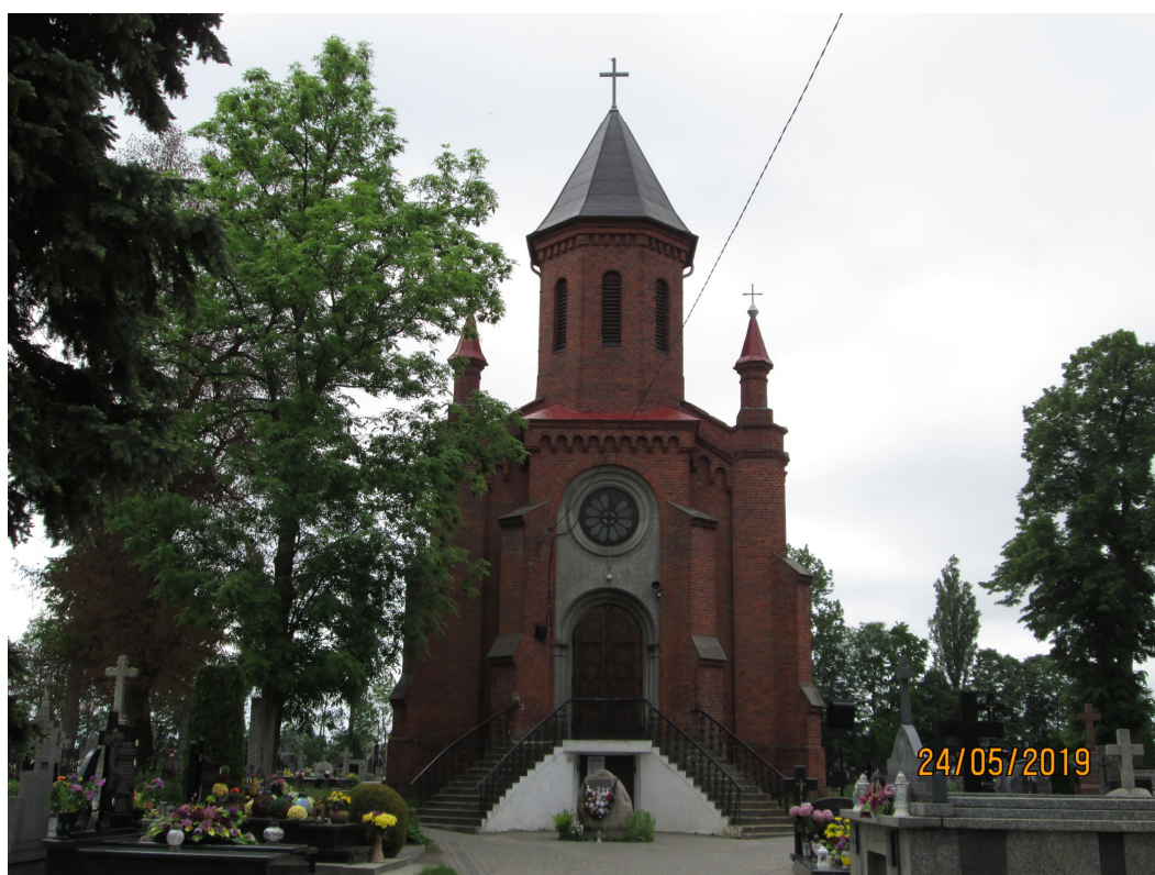
Fot. nr 5. Kaplica cmentarna na cmentarzu rzymskokatolickim, ul. Kościuszki w Węgrowie