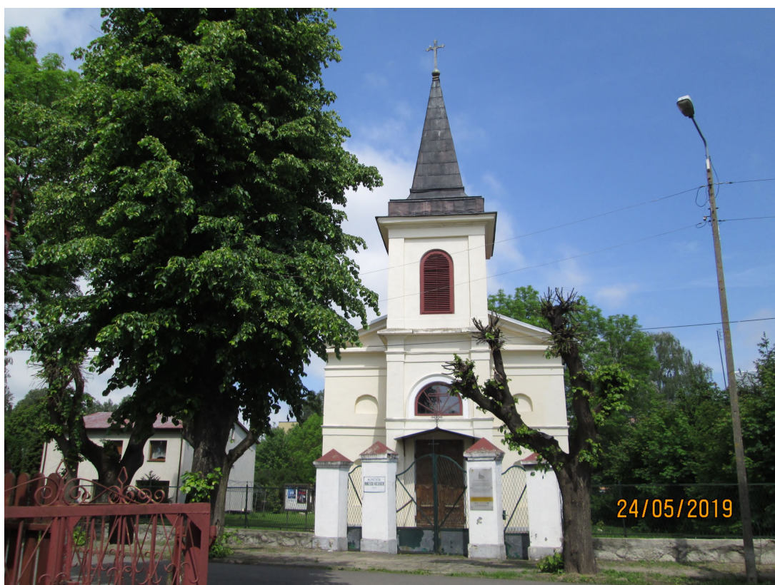
Fot. nr 6. Kościół ewangelicko - augsburski pw. Świętej Trójcy, ul. Narutowicza w Węgrowie