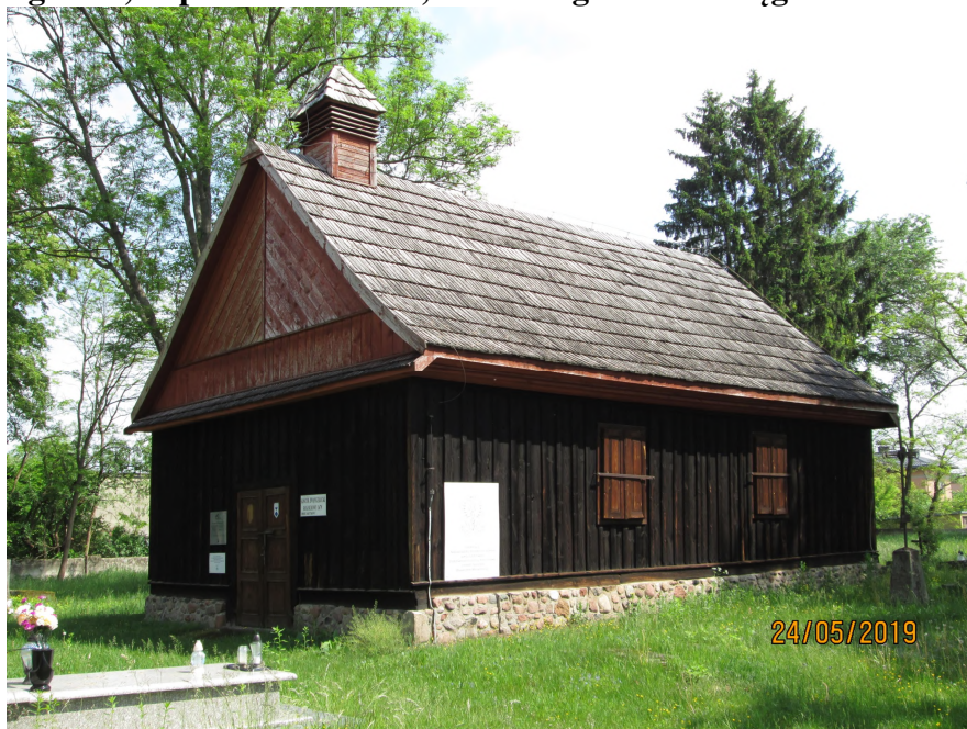
Fot. nr 8. Kościół ewangelicki, kaplica cmentarna, ul. Ewangelicka w Węgrowie