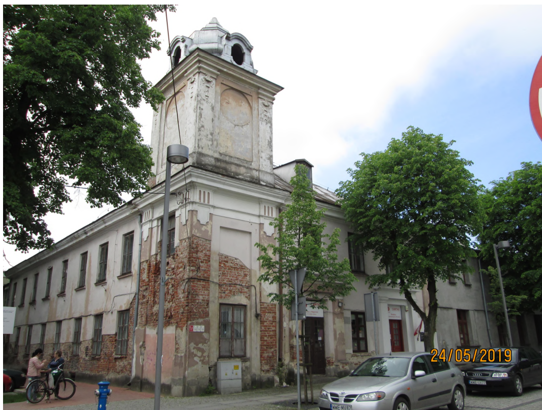
Fot. nr 3. Kolegium Księży Komunistów, ul. Kościelna 2 w Węgrowie